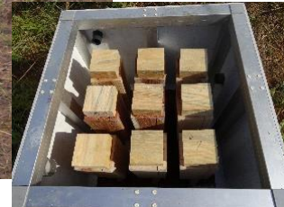
試験枿 試験体配置状況