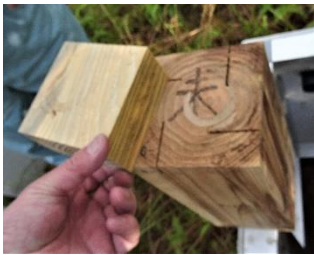
6-1 試験体上部食害発生 (設置後7ヶ月)