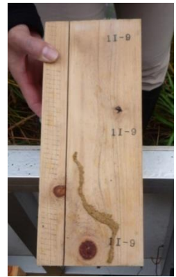
11-9 試験体 側面に蟻道あるも途中で断念 試験体食害無し