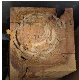
10-1 試験体上部食害状況 (設置後1年11ヶ月)