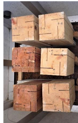
7-4～9 試験体 (設置後3年9ヶ月) 食害無し