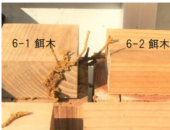
6-1 餌木 6-2 餌木